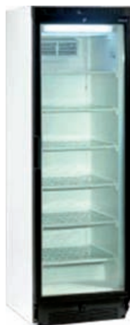
LBS - 372 MBS - 300