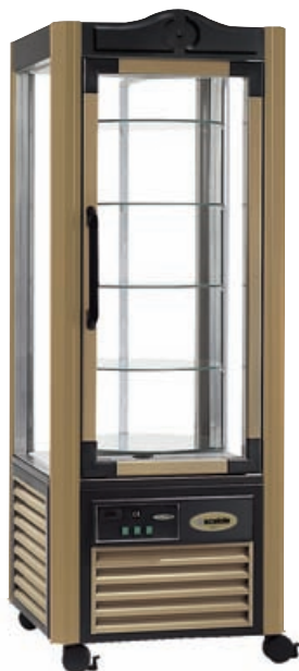
ERG - 400