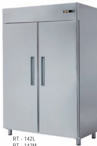
RT - 142L RT - 142M