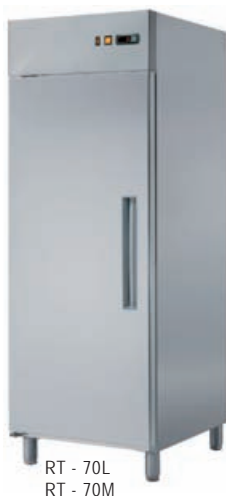
RT - 70L RT - 70M