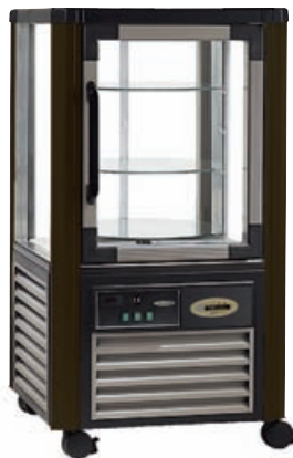
ERG - 250